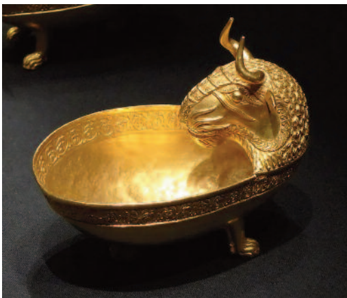
Bikafejes ivócsanak, a Nagyszentmiklósi kincs darabja